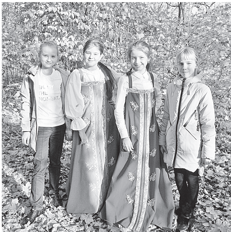
Активисты клуба «Радуга» при библиотеке-филиале № 1 на ул. Сушанской

В библиотеке создан клуб «Радуга» для учащихся пятых классов седьмой школы. В фольклорном клубе библиотекари