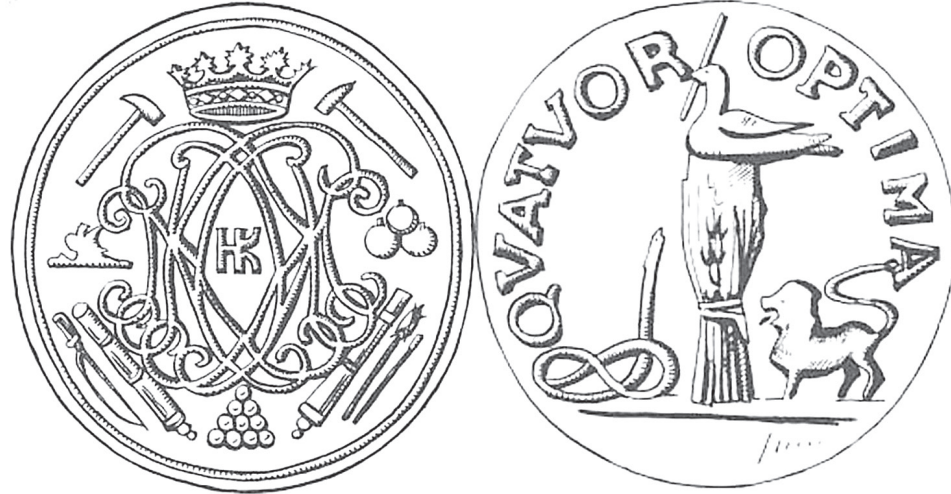
Личная печать Главного горного командира Урала и Сибири Н.Г. Клеопина

Поражает в небольшом городе (почти в три раза меньше Боровичей) ботанический