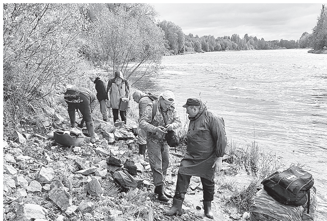
Палеоботаники изучают берег Мсты, богатый остатками древних растений