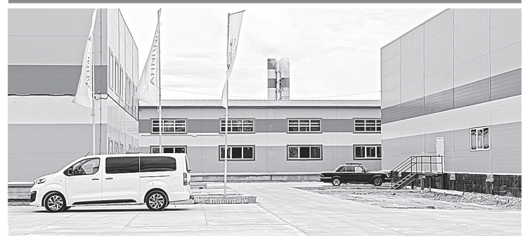
Индустриальный парк «Преображение» в Боровичах