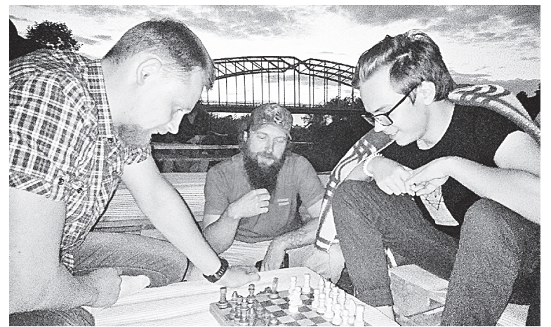
Открытый лекторий на набережной Мсты привлёк на свои мероприятия более тысячи участников

Квота на количество учащихся предпенсионного возраста предоставлена учебным заведениям на год, в течение которого будут формироваться группы студентов старшего возраста. К примеру, в медицинском колледже по специальности «Младшая медицинская сестра по уходу за больными» компетенции «Медицинский и социальный уход» первая группа начала занятия в составе 14 человек, шестеро из которых новгородцы,