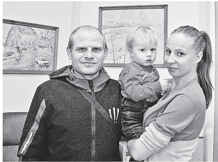
Счастливые новосёлы дома № 21 по улице Гагарина (п. Прогресс)