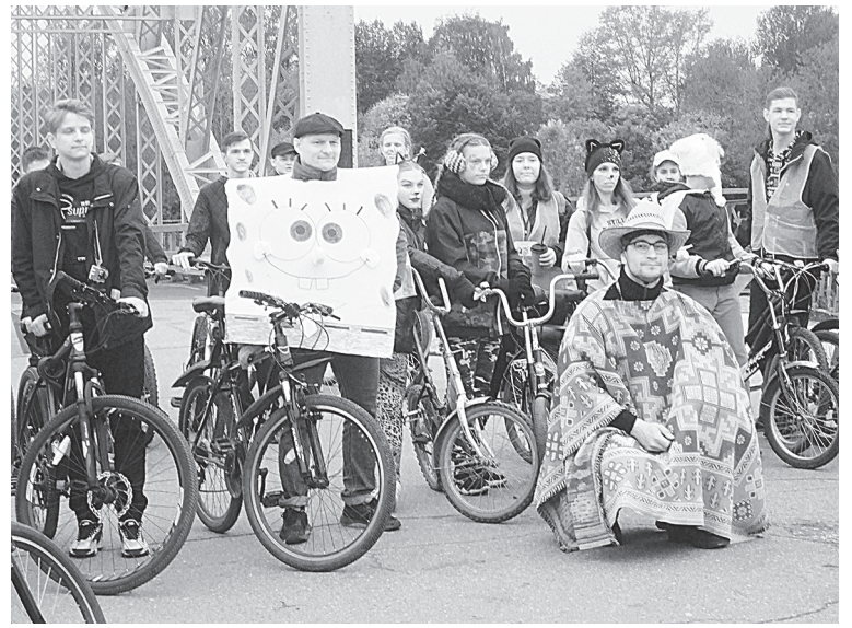
На старт, внимание, марш!